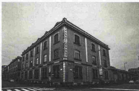
Lo stabilimento Branca dove, durante la Settimana della cultura d'impresa, si visita la Collezione

Una proiezione in anteprima del documentario di Francesca Molteni Newmuseum(s). Stories of company archives and museums , inaugura giovedì 8 alle 18 all'Assolombarda, in via Pantano 8, l'edizione 2018 della "Settimana della cultura d'impresa" promossa in tutta Italia